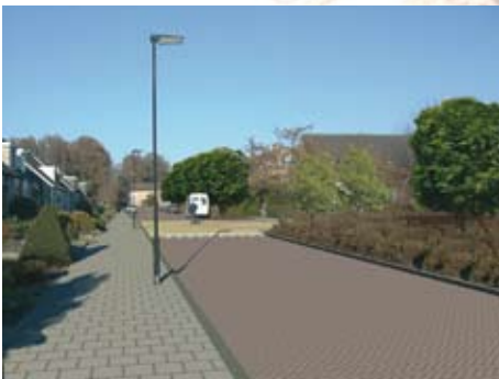
Nieuwe situatie (visualisatie)

Vervolgens is er met een kleine groep bewoners (zogenaamde klankbordgroepen) regelmatig overleg geweest om de plannen bij te schaven en definitief te maken. Nadat de plannen definitief gemaakt waren, hebben wij wederom een (feestelijke) avond georganiseerd om met de hele buurt te proosten op de te hernieuwen wijk.